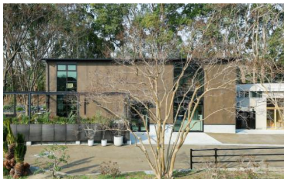
「100ORE SCENES(センリシーゼズ)」外観

※本案件は、大阪府豊中市も14日付で発表していますのでそちらのリリースも参考資料として添付しております。